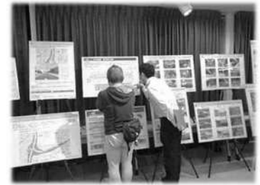
みなさまからのご相談やご質問には、担当者が個々に対応いたします。

また、参加をご希望される住民の皆様と事業者による意見交換の場も 併せて設けさせていただきます。