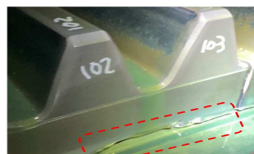
大ギアの変状状況