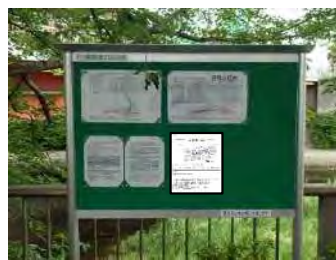
掲示板設置イメージ

シールドトンネル工事の進捗状況、振動・騒音、地表面のモニタリング情報を皆様にお知らせするため、掲示板に工事情報などを掲示いたします。