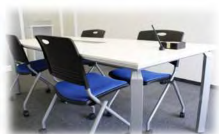
【相談ブース(イメージ)】