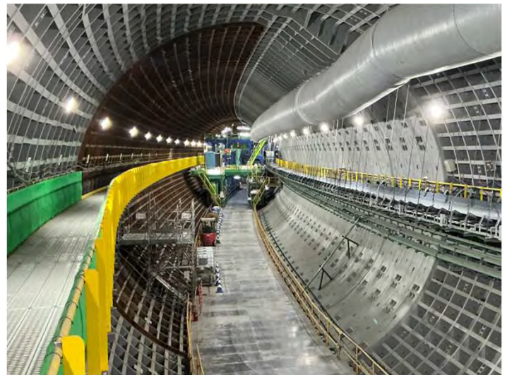
Hランプ坑内（シールド先端部）