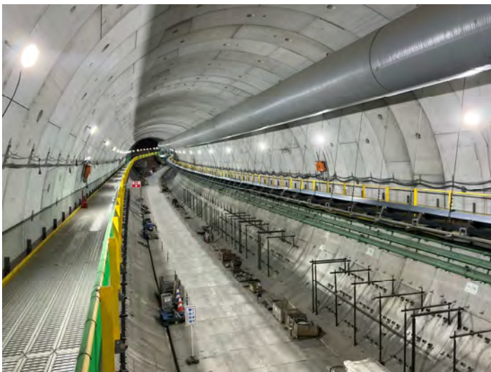
Hランプ坑内（シールド構築状況）