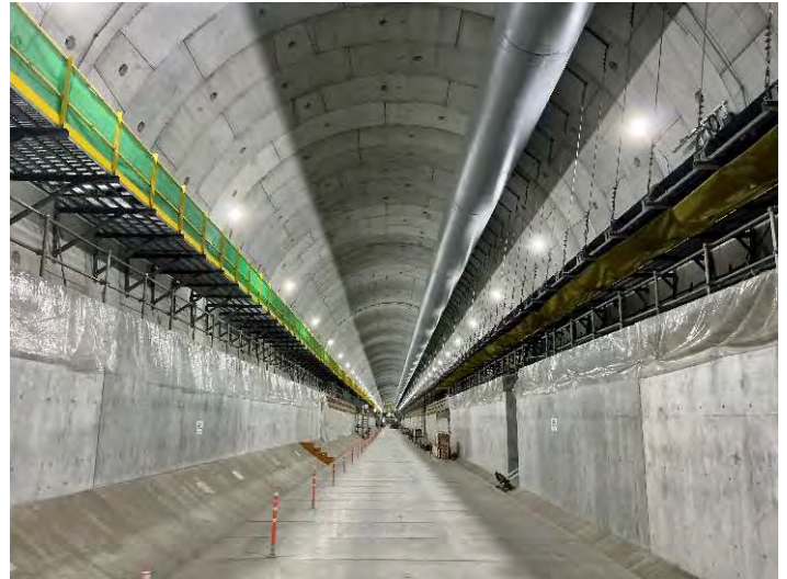
Hランプ坑内（シールド構築状況）