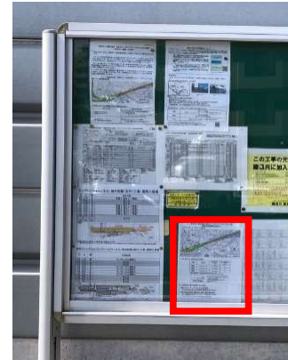
【掲示板設置イメージ】