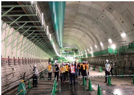
大泉側本線シールドトンネル