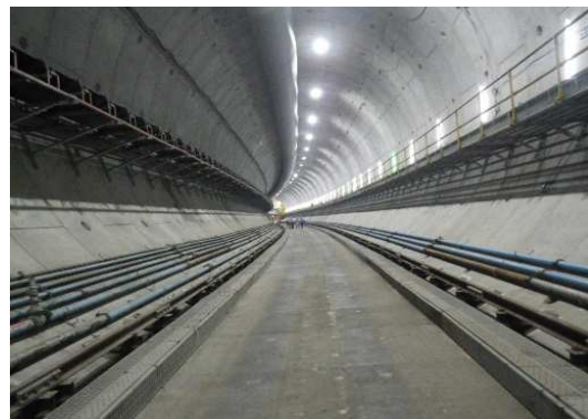
中央JCT Hランプシールドトンネル