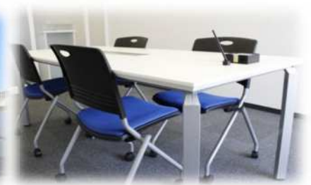
[相談ブース (イメージ)]