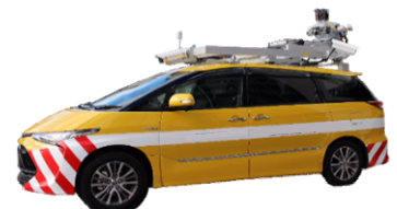
3D点群データ調査専用車両