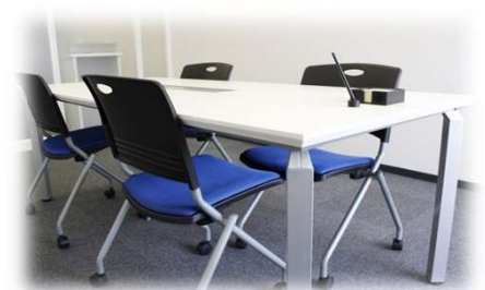
【相談ブース (イメージ)】