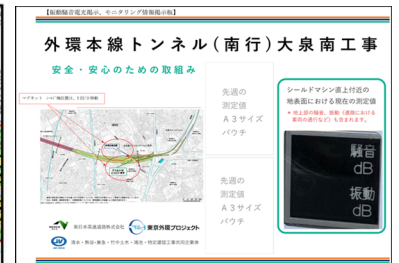
【掲示板設置イメージ】