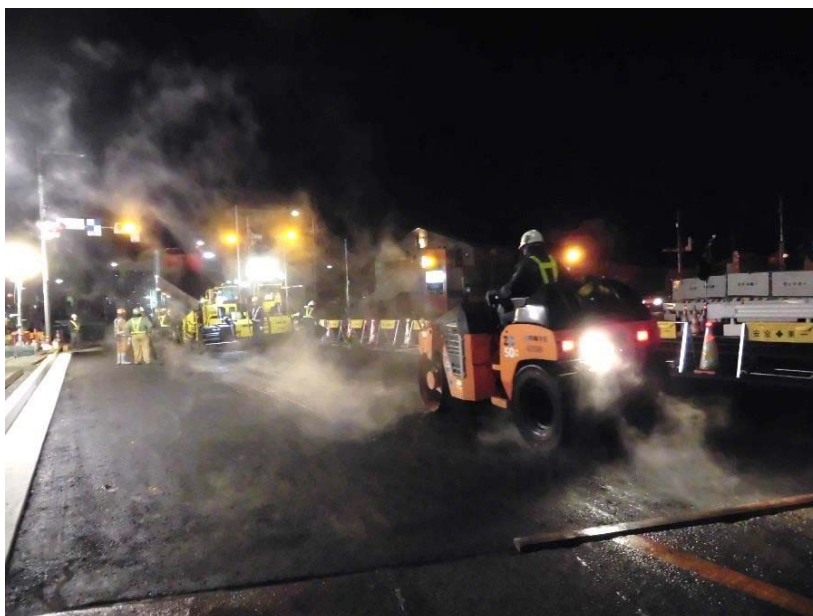
アスファルトの敷き均し・締め固め