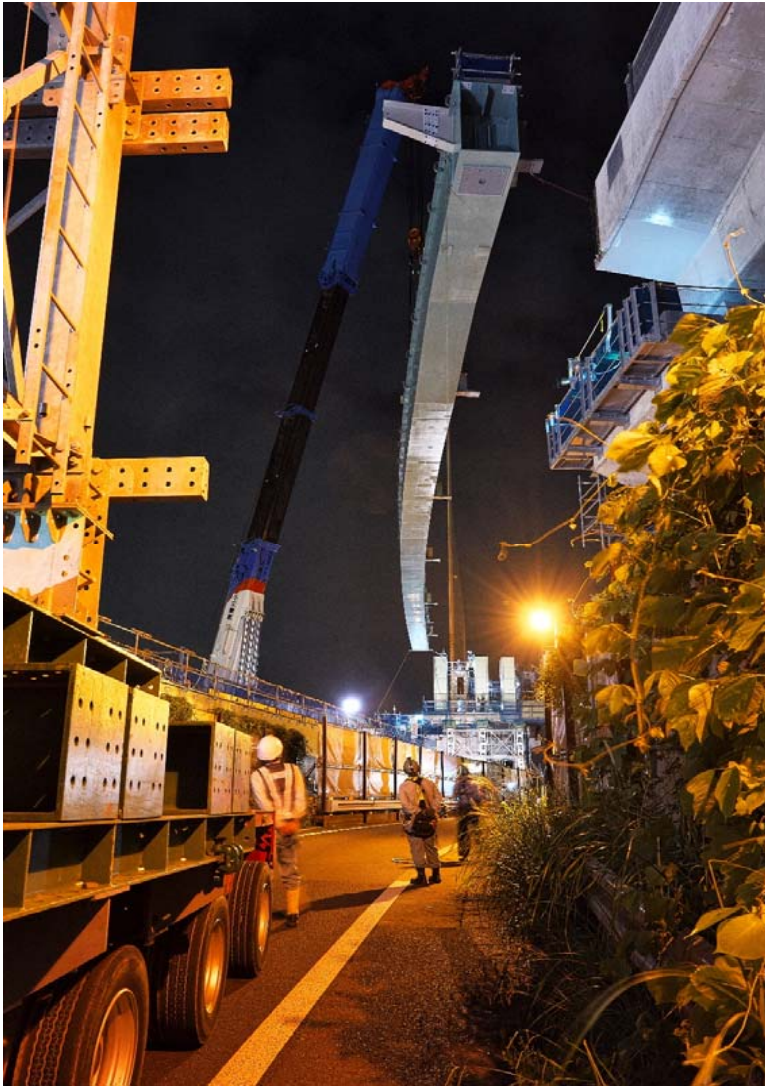
550t吊りクレーンによる橋桁の架設状況(9/17)